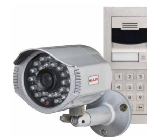
Les platines de rue vous permettent de voir qui est à la porte d'entrée, et plusieurs caméras offrent une vue complète sur le porche.