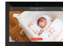
Profitez d'images plein écran et d'audio haute qualité pour chaque écran tactile.